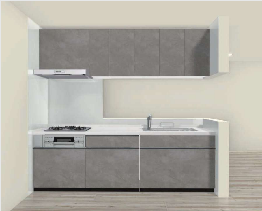
実物を撮影した画像ではないため、実物と異なる場合があります。見積記載品以外はイメージです。*床名：グレージュエルフ(DC)横・ラシッサD